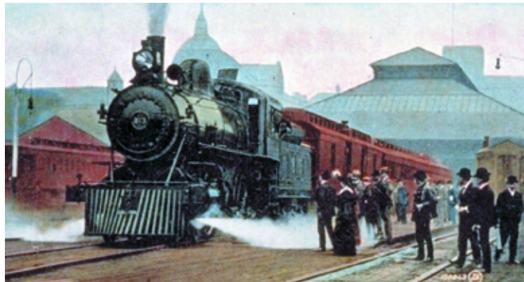
L'Imperial Limited Trans-Continental Express quittant la gare du Canadien Pacifique (Windsor) de Montréal, à destination de Vancouver (c.1910).

En 1927, la Fraternité adopte un rituel de reconnaissance entre membres pour contrer l'intimidation dans le recrutement. Seuls les membres en règle recevaient le mot de passe ( Solidarity ) et le signe (le bras gauche, poing fermé, dirigé vers le bas).