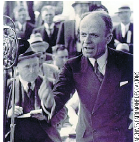
ARCHIVES PATRIMOINE DES CANTONS