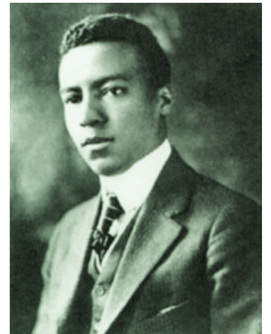
Asa Philip Randolph (1889-1979). Un des fondateurs, en 1925, de la Brotherhood of Sleeping Car Porters (Fraternité du personnel des wagons-lits et préposés aux trains de voyageurs). Après douze années de campagne, il réussit à arracher la reconnaissance de la Fraternité et un premier contrat avec la Pullman, le principal employeur, en 1937.

Lors de la formation de Via Rail, la Fraternité des porteurs doit fusionner avec la Fraternité des cheminots, qui aujourd'hui fait partie des TCA-FTQ.