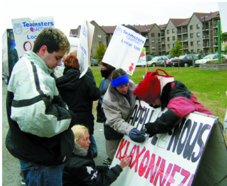
Au début du conflit, les grévistes préparant leurs pancartes.

Entre-temps, les Teamsters ont réussi à syndiquer deux autres établissements appartenant à la même chaîne des Résidences Soleil, soit le Manoir Saint-Laurent et le Manoir Granby. Ils comptent y signer des contrats de travail semblables à celui négocié au Manoir Saint-Hilaire.