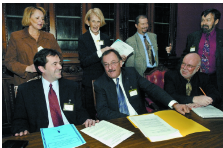
On se prépare et on se détend en attendant d'entrer en commission parlementaire.