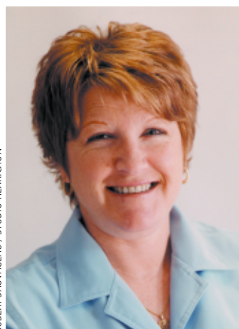
ROBERT SAUVAGEAU / STUDIO HENRICHON

« Alors qu'ici nous manquons de médecins, j'ai découvert que, là-bas, des médecins sont en chômage à cause du désengagement de l'État qui manque d'argent pour les payer. Donc, ils se regroupent pour mieux s'organiser. »