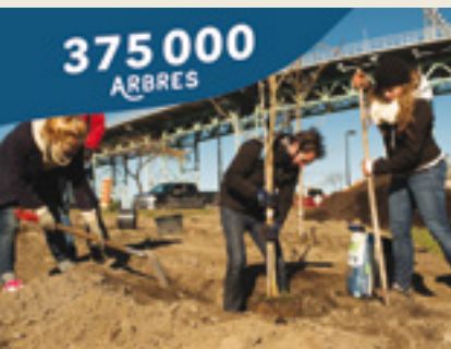
JOUR DE LA TERRE

Pour en savoir plus, rendez-vous au stand du Jour de la Terre dans le foyer du Palais des congrès.